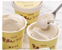
品番 KB 栗あんアイス 8コ入 [120ml×8] 3,996円(税込) ※価格にはドライアイス、増量代540円(税込)が含まれています

いろいろな選べるおたのしみ 栗いろいろ 味わいそれぞれ、ゆつたりしたお茶の時間のお供に。栗生菓子の詰合せです。