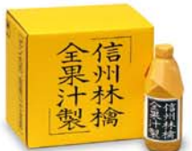
品番 AJ3 全果汁リンゴジュース 3本入 [800mlビン×3] 2,592円(税込) 品番 AJ5 全果汁リンゴジュース 6本入 [800mlビン×6] 5,184円(税込)

信州リンゴのエキースト 丹精がこもる リンゴのジュレ 完全熟した紅玉りんごを丸ごと煮込み、手間ひまかけてできた琥珀色の珠玉のジュレ。特有の酸味と甘み、滑らかさが絶品と好評。