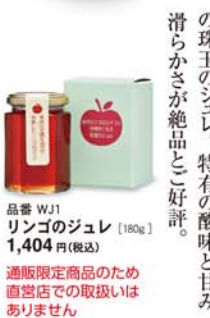
品番 WJ1 リンゴのジュレ [180g] 1,404円(税込) 通販限定商品のため直営店での取扱いはありません

信州リンゴのエキースト 丹精がこもる リンゴのジュレ 完全熟した紅玉りんごを丸ごと煮込み、手間ひまかけてできた琥珀色の珠玉のジュレ。特有の酸味と甘み、滑らかさが絶品と好評。