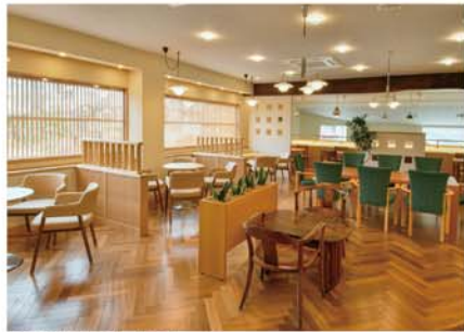
長野駅前店 2階 喫茶室