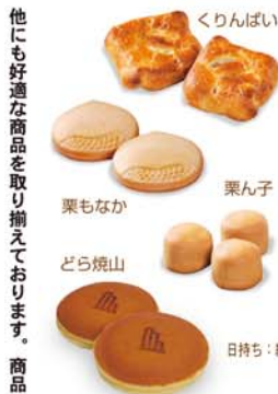
他にも好適な商品を取り揃えております。商品カタログ『栗いろいろ』もご覧ください。