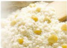
品番 W05 冷凍栗強飯 5袋入 [200g袋×5コ入] 3,510円(税込) 日持ち: 冷凍庫で約4か月 贈り物です。お祝いにふさわしい響き合う絶妙な味わい。

栗強飯 手むきした国産栗とふくらおこわが響き合う絶妙な味わい。お祝いにふさわしい贈り物です。