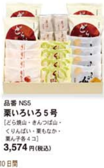
品番 NS5 栗いろいろ5号 [どら焼山・きんつば山・くりんばい・栗もなか・栗ん子各4コ] 3,574円(税込) 日持ち: 約10日間