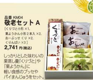
品番 KMO4 敬老セットA [くりづと小形×1、栗ようかん小形2本入×2、おーぶっせくり×2、くりんばい×3] 2,741円(税込)

伝統名菓の「栗ようかん」「栗かの子」に人気の「どら焼山」「きんつば山」と、温かいおしるこを「栗あんしるこ」を組合せた季節にふさわしい詰合せ。