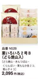
品番 NS2B 栗いろいろ2号B [どら焼山入] [どら焼山・きんつば山・くりんばい・栗もなか各2コ、栗ん子4コ] 2,095円(税込)