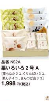
品番 NS2A 栗いろいろ2号A [栗もなか2コ、くりんばい3コ、栗ん子4コ、きんつば山3コ] 1,998円(税込)