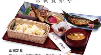
山家定食 栗おこわに、紅鯉甘露煮、山菜煮物など、山野の幸をあつめたお食事。

*なお、栗の入荷仕込みの状況によっては時期が前後する場合がありますので、「ご了承ください」。