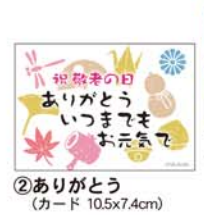
①木の葉 (カード 10.5x7.4cm) ②ありがとう (カード 10.5x7.4cm) *商品やサイズによりお付けできない場合がございます。

敬老の日 感謝カード をお付けします。 ご注文の際にご希望の番号と「カードを添えて」とお申し付け下さい。 9月17日敬老の日当日にお届けご希望の場合は、その旨をご指定の上、お早めにご利用下さい。