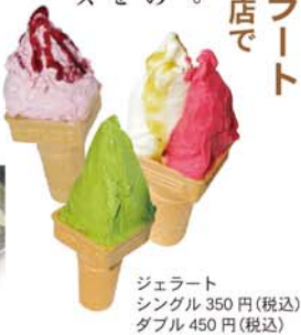
ジェラート シングル 350円(税込) ダブル 450円(税込)

竹風堂のオリジナルジェラート 長野駅前店 小布施マローネの2店で 竹風堂のジェラートは、すべて自社工場製。地元素材や季節の果物を使ったこだわりの味わいです。自慢の栗あんや、オブセ牛乳をはじめ、地元産のさくらんぼ・チェリーキッスなど、常に10種をこえる品揃え。