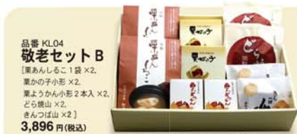
品番 KLO4 敬老セットB [栗あんしるこ1袋×2、栗の子小形×2、栗ようかん小形2本入×2、どら焼山×2、きんつば山×2] 3,896円(税込)