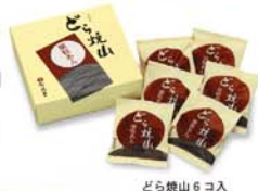
どら焼山 6 コス

品番 D10 どら焼山 10 コス 2,268 円(税込) 日持ち：約 10 日間