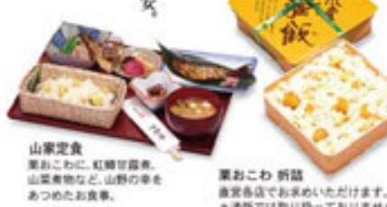
山家定食 栗おこわに、紅揚げ豆腐、山菜煮物など、山野の幸をあつめたお食事。 栗おこわ 折詰 直営各店でお求めいただけます。*通販では取り扱っておりません。

「華厳妙韻」販売再開は11月初めごろ これ以上どうやってもないという、最上級の栗粒入り栗ようかん華厳妙韻は、思いのほかご好評で専用の原料栗が底をついてしまいました。ありがとうございます。 9月中旬ごろから約40日にわたる栗仕込みを経て、新栗を用いた華厳妙韻の再登場は11月初めとなる予定です。 パッケージの不具合も修整中です、どうぞお楽しみに。