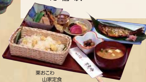
栗おこわ山家定食

2 長野駅前店 TEL. 026-213-8155 [販売] 8:00~18:00 [喫茶] 10:00~18:00 (LO17:30) 長野駅善光寺口2階から歩廊づたいに約4分、エレベーターで地上に。末広町交差点角。 〇なし