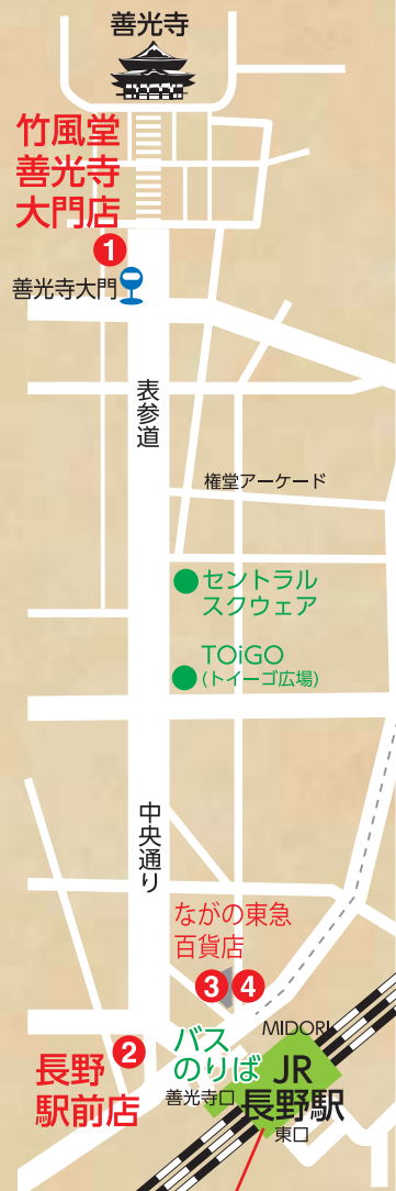
長野駅構内2階略図

国宝善光寺門前に位置する「善光寺大門店」はじめ、「長野駅前店」「ながの東急店」「茶寮さろんどまるん」の直営4店舗のほか、長野駅構内の売店にも竹風堂栗菓子をお買い求めいただける売店がございます。どうぞご利用ください。