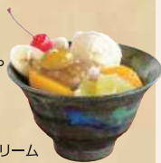
クリーム栗あんみつ

2階 食事・喫茶ルーム おなじみの栗おこわ定食や麦とろ定食、栗甘味などが味わえます。